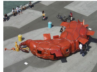
Atelier van Lieshout, "Bar rectum", 2005