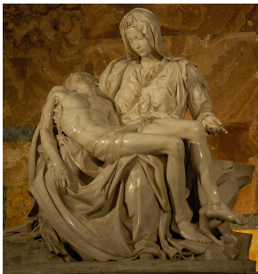
Michelangelo, Pieta, 1499