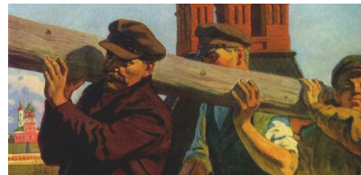
Voorbeeld van sociaal-realistische kunst