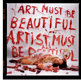
Marina Abramovic, Performance