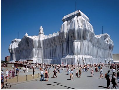
Christo, Ingepakte Reichstag, 1995