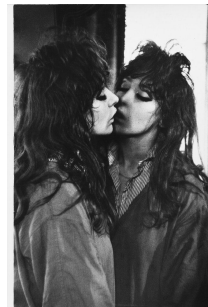
Ed van der Elsken, "Een liefdesgeschiedenis in Saint-Germain des Prés", 1954