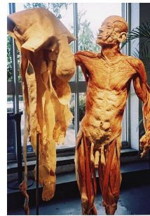
Uit: Günther von Hagen, "Body worlds"